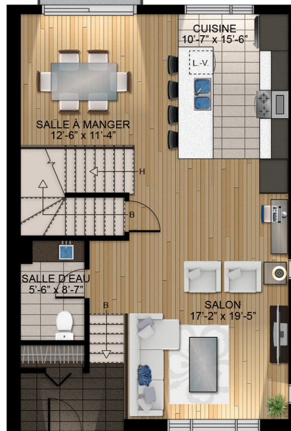
RDC 805 pi 2